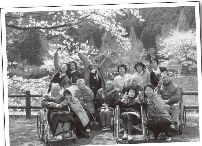
皆で揃ってのお花見は…最高で～すう\(^o^)/