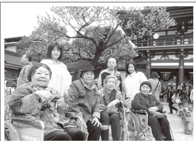
大宰府天満宮の梅は見ごたえ満点ねえ～♪