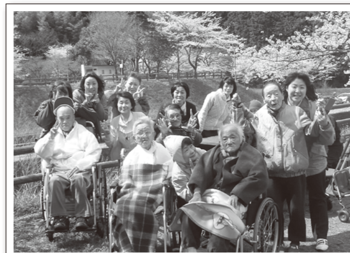
満開の“笑顔”で！ハイ！ピースう！！