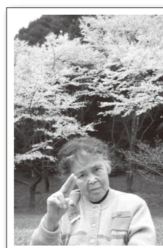
カメラを向けられるとついピース！