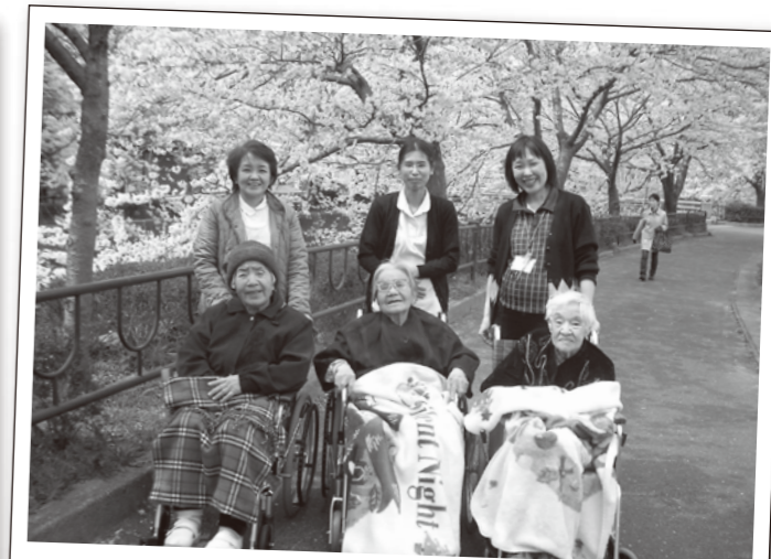
職員さんと一緒に記念撮影 ^^