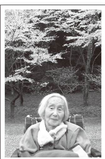
綺麗な桜にうっとり♪