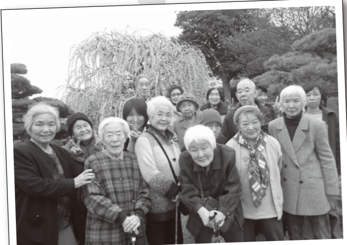
見事な「枝垂れ梅」に目尻も垂れちゃうわ～♪

「さくら～♪ さくら～♪」って思わず唄ってしまうほど見事な桜に思わずうっとり今年も、お花見ドライブにでかけました。私たちも元気を沢山もらって、「来年もこの桜を見に来よう！」って誓いました。