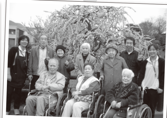
梅見時！ みんなで見れた！！ 枝垂れ梅！！