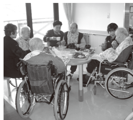
▲ふれあいお食事会

平成二十四年度が、スタートしました。今年度は、三年に一回の介護報酬の改定で、当苑としても様々な高齢者支援事業を行ってまいりますが、今回の改訂は、大変「厳しい」状況となりました。個人としても、介護保険料が上がるわけですから、同様です。