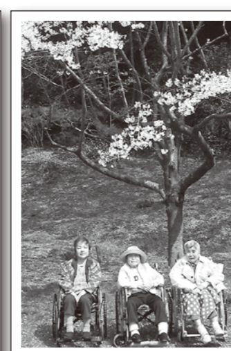
桜を前に三人で記念撮影 パシャ！